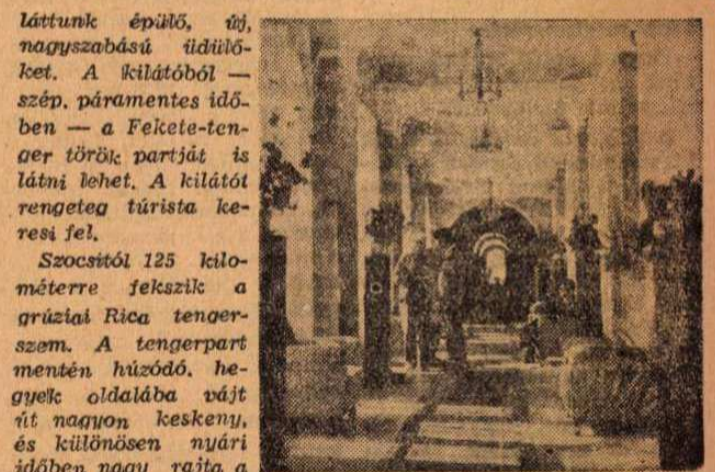
Az „Uj Szocsi” szanatórium hallja.

Szocsitól 15 kilométerre van a kaukázusi Ahun-hegy. A hegyre vezető út mentén — mielőtt még a sziklák részekhez érünk, öreg palmafák, törpe fügefák és szép virággyaak váltakoznak. Az utat helyenként sportolókat ábrázoló szobrok díszítik. A kilátóhoz szerpentin vezet. Az út mentén több helyen